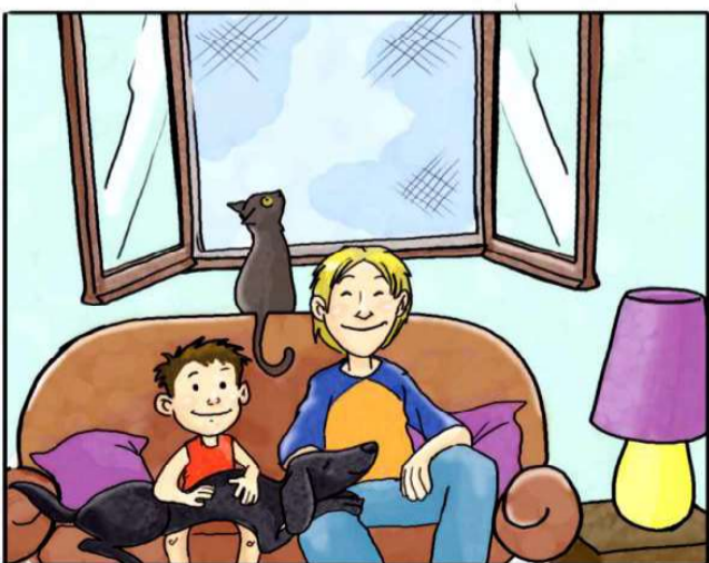
IN CASA USA LE ZANZARIERE ANZICHÉ ZAMPIRONI E FORNELLETTI.