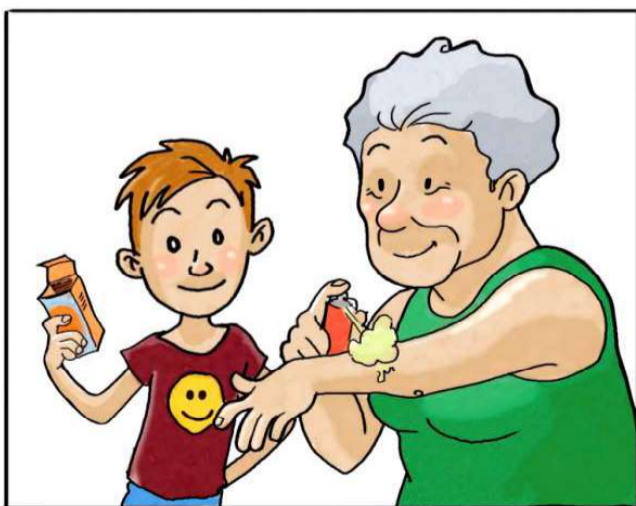
USA I REPELLENTI CUTANEI SEGUENDO LE INDICAZIONI RIPORTATE SULLE CONFEZIONI.