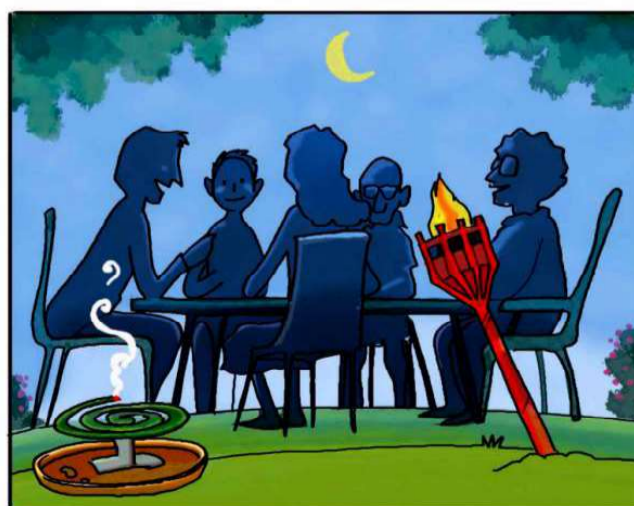
QUANDO SOGGIORNI ALL'APERTO, PROTEGGITI CON REPELLENTI AMBIENTALI. (*)

(*) Leggi attentamente le istruzioni riportate sulle confezioni.