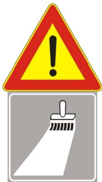
Figura Il 391 Art. 31