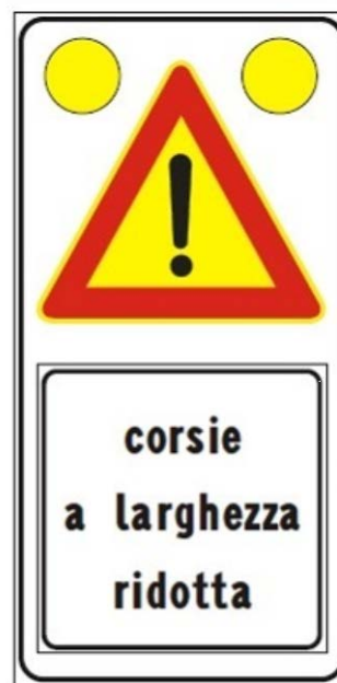
Figura Il 391c Art. 31